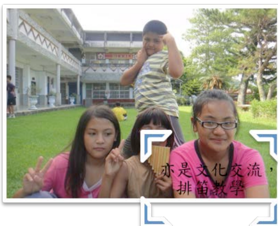
亦是文化交流，排笛教學

們為你帶來許些的想法。此行最大的收穫，是有機會可以親身體會台東的小朋友所身處的環境，常常我們說他們資源不足，但是究竟是貧乏到哪种程度，若沒有親身經歷，恐怕只是紙上談兵，經歷了才知道自己有多幸運。我將