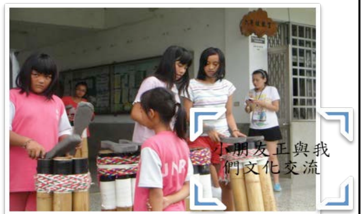
小朋友正與我們文化交流

在上大學之前，我一直都很喜歡當志工。心想若能藉一份心力，哪怕是微弱之力，來回饋社會何樂而不為呢？很開心能參與第一屆與第二屆偏遠地區英文教學營「台東加拿國小」與「台南南興國小」。加拿國小的小朋友普遍來說，都是原住民小朋友，他們對我們這些大哥哥、大姊姊都好新奇；我們亦是。當我們抵達國小時，小朋友很開心的迎接我們，甚至幫忙搬運東西。