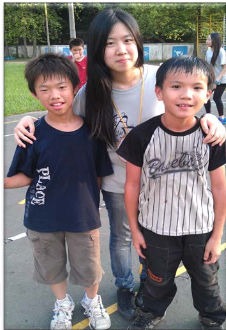
放學時間，和小朋友們一起打籃球。

這個學校的口琴隊很出名，總會參加校外大小的比賽，學校裡的每位小朋友都會吹奏口琴。記得有一次上課，他們齊聲說可以表演口琴給我們聽，於是那幾個平常調皮