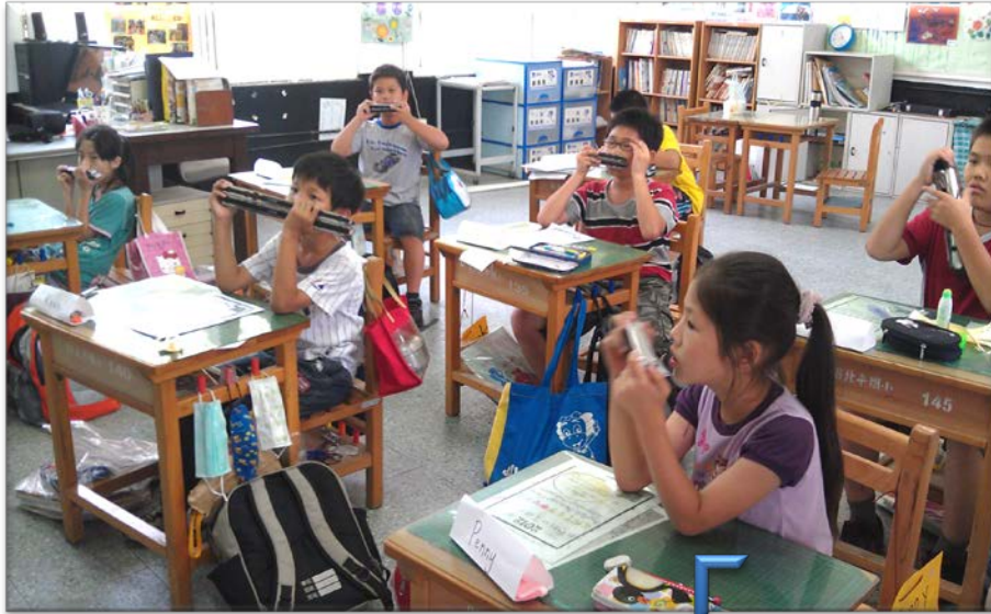
全班吹奏口琴給我們聽